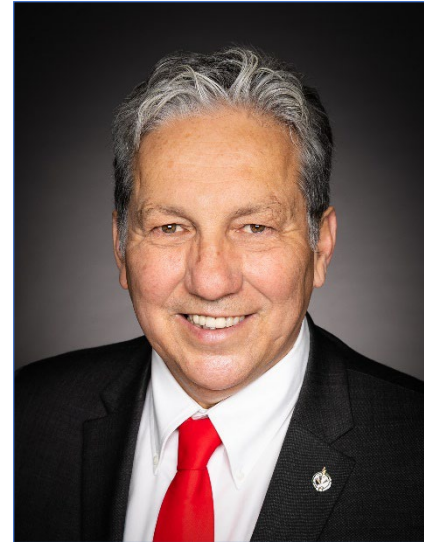
L'honorable Dan Vandal, Ministre des Affaires du Nord, ministre responsable de Développement économique Canada pour les Prairies et ministre responsable de l'Agence canadienne de développement économique du Nord

Nous vous invitons à lire ce rapport pour découvrir comment CanNor façonne la durabilité économique et la prospérité à long terme dans les territoires.